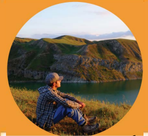
Pasen Tiempo en la Naturaleza

Escribe cosas por las que estás agradecido(a)