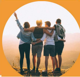
Pasar Tiempo con Amigos(as)

Ir al Parque Ver una Película Tengan noche de Juegos