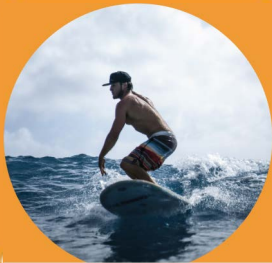
Encuentra un Pasatiempo

Refugio de Animales Vivienda de Ancianos Despensa de Alimentos