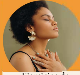
Ejercicios de Respirar

Inhale por 4 Mantener por 7 Exhale por 8